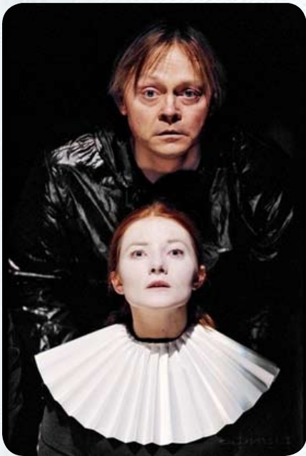
«Гамлет» - необычный спектакль, как и все, что делает Оксарас Коршуновас