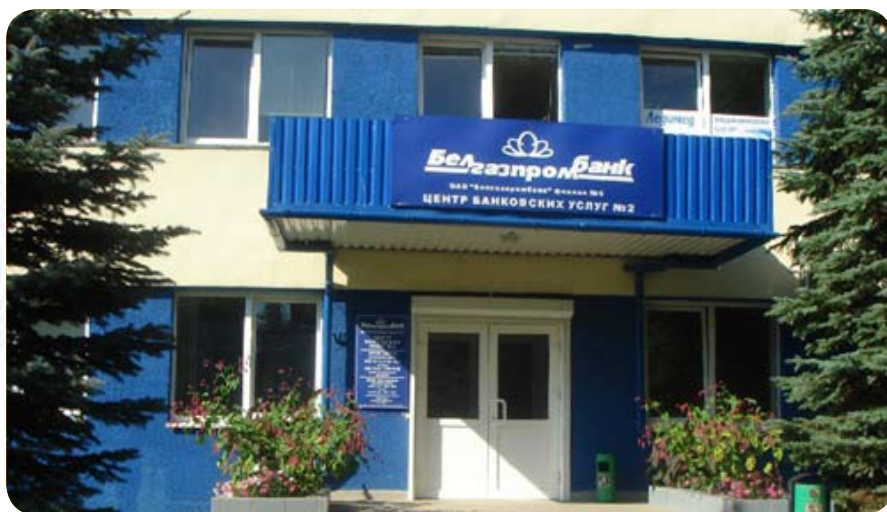
День «трех семерок» (7.07.2007), когда открылось Лидское ЦБУ, стал счастливым