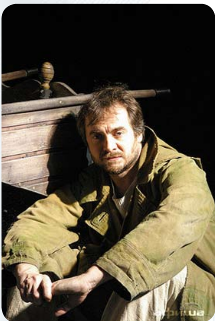
Спектакль «Даниэль Штайн, переводчик» по роману Людмилы Улицкой в постановке питерского «Театра на Васильевском» получил высшую театральную премию Санкт-Петербурга «Золотой софит»

Национальный центр Гренобля привозит постановку «Дафнис и Хлоя» — доста-