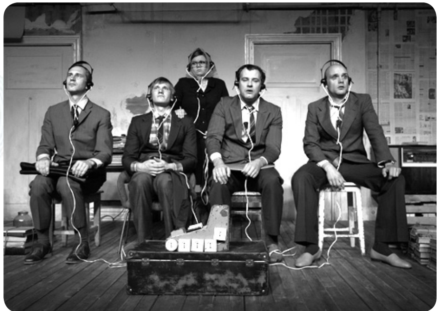
Спектакль «Звук тишины» Алвиса Херманиса наверняка станет хедлайнером «Театральной недели с Белгазпромбанком»

Оскарас Коршуновас – это наш давний друг, мы следим за его творчеством и вообще, остаемся приверженцами литовского театра. В этом году в Минск приедет «Гамлет» — необычный спектакль, впрочем, как и все, что делает Оскарас. Это не самая последняя его работа, но мы считаем необходимым показать белорусским зрителям именно ее, в продолжение предыдущих историй в его исполнении, которые ссылались на мировую классику.