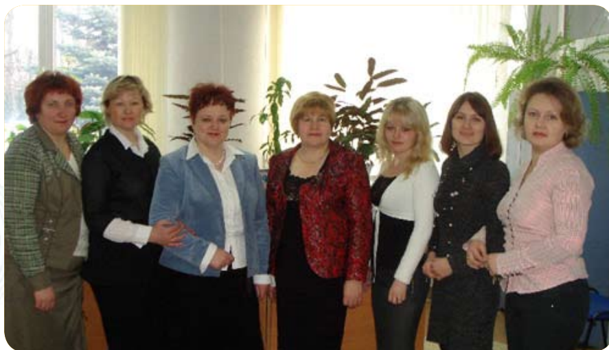
Дружная команда ЦБУ №2 (г. Лида)

Перспективы развития банка в Лидском регионе были связаны именно с обслуживанием предприятий малого и среднего бизнеса, их всесторонней поддержки. Трудовой коллектив нашего ЦБУ начинался с 5 человек, сейчас в нашем штате 8 сотрудников.