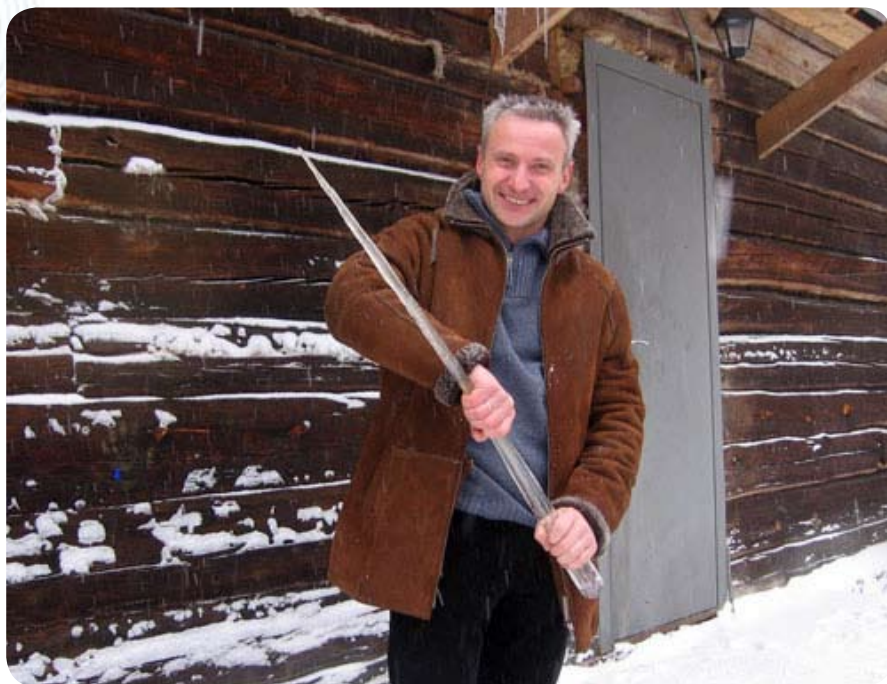
С крыши расположенной рядом бани свисали сосульки невероятного размера

И все же самым главным событием, ради которого участники VIP-клуба вместе собрались, стало Крещенское купание. Многие решились на этот шаг впервые в жизни, но сделать это в кругу единомышленников легче, чем в одиночку.