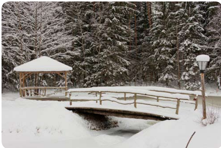
Окружающая природа в этот день напоминала настоящую зимнюю сказку