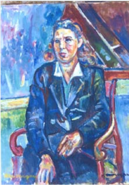
Пинхус Кремень, «Сидящая женщина» (около 1940 г.)