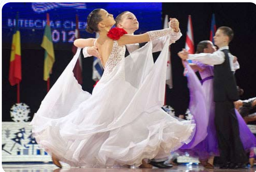
Турнир проводился в различных возрастных категориях, начиная от 7-летних участников и заканчивая «синьорами», чей возраст превышает 35 лет

«Витебская снежинка» проводится в городе на Двине уже в 27-й раз, и за эти годы соревнования стали заметным событием в жизни «культурной столицы» Беларуси.