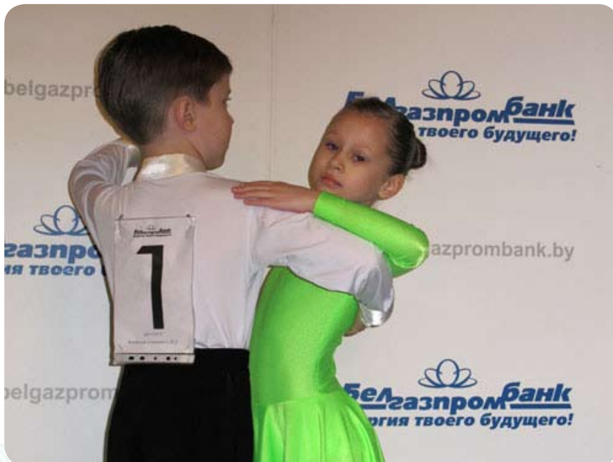
Белгазпромбанк второй год подряд выступает одним из партнеров «Витебской снежинки»