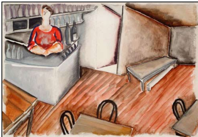
Бар, гуашь, 1920