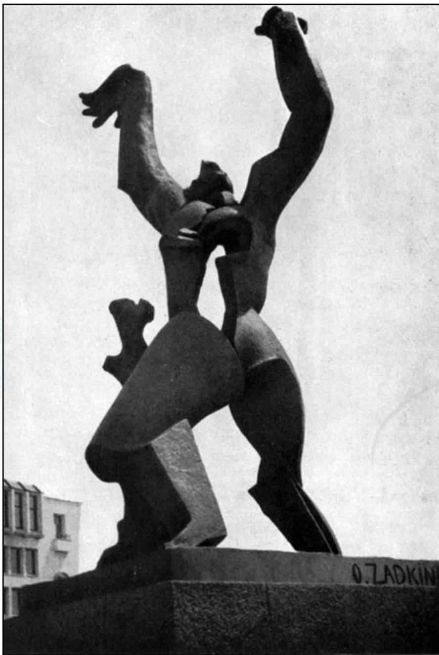
Памятник разрушенному Роттердаму, 1953

Тревога за судьбы человека и человечества не оставляет художника и в послевоенное время. Барочные тенденции,