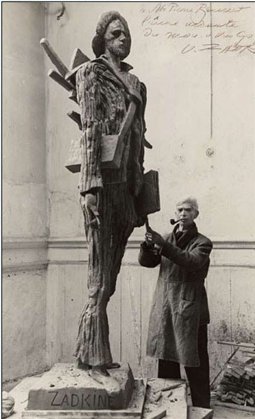
Осип Цадкин у скульптуры Ван Гога. Фото

Творчество Цадкина вобрало всю страстную любовь к природе, человеку и лучшим его творениям — музыке, литературе, поэзии. Это был художник глубочайшей культуры. Творчество скульптора полно страстного переживания за судьбу человека. В 1950 году он получил Гран-при Венецианского Биеннале, в 1960-м — был удостоен