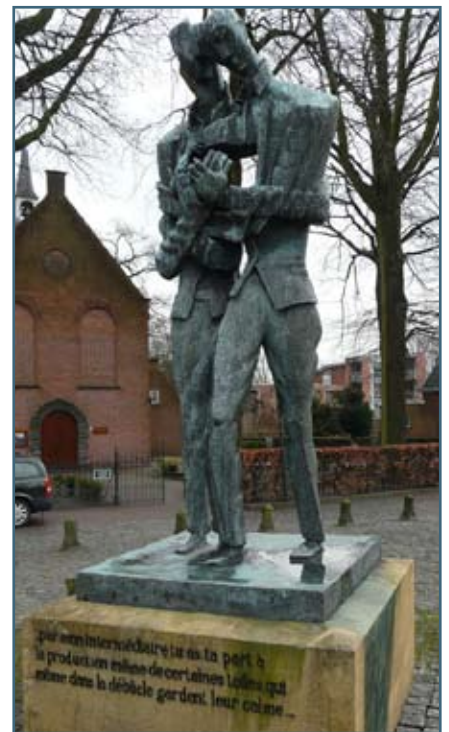
Скульптура Винсента и Тео ван Гога, 1964

Табличка на музее в доме на парижской улице д'Ассас (VI округ), открытом в 1982 году. Именем скульптора названа улица в XIII округе Парижа. Жак Ширак, будучи мэром Парижа, отдал распоряжение разместить скульптурные произведения Цадкина по всей французской столице.