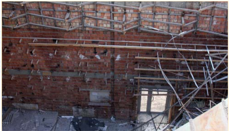
Так сейчас выглядит вход в бывший операционный зал с высоты

Девизом работы сотрудников управления делами должен быть слоган: «Мы решаем вопросы, а не создаем новые проблемы». Для достижения этой цели уровень функционирования управления делами должен быть адекватным уровню нашего банка как одного из ведущих финансово-кредитных учреждений республики.