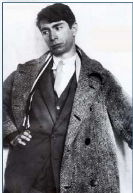
Фото О.Цадкина, 1922

В октябре 1909 года Цадкин решает ехать в Париж, ибо «там становятся художниками». В столицу Франции он прибывает с рекомендательным письмом в художественную академию Эколь-де-Бозар, однако уже через год покидает ее. Его воодушевляет моральный климат Монпарнаса. Весной 1911 года он впервые выставляет пять скульптур в Салоне независимых. В том же Салоне свои скульптуры представляют Александр Архипенко и Вильгельм Лембрук. Вскоре они подружатся.