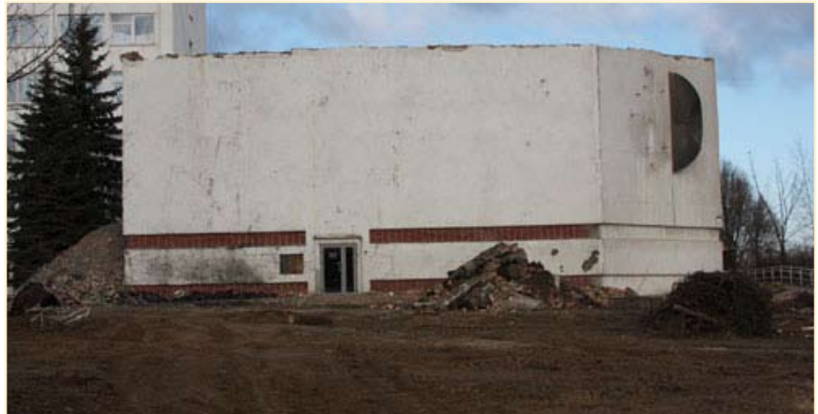
Площадка под будущее строительство уже расчищена

— Исходя из того, что управление делами является обслуживающим подразделением, цель деятельности его сотрудников должна быть подчинена задачам качественного обслуживания всех подразделений банка, у которых должны складываться позитивные эмоции от обращения в управление делами.