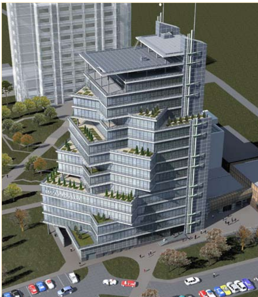
Так будет выглядеть новое здание головного офиса Белгазпромбанка после завершения строительных работ

Наши постоянные читатели должны помнить, что два года назад мы рассказывали о начале строительства здания головного офиса банка в районе автовокзала «Московский». Однако позднее в эти планы были внесены коррективы, озвученные председателем правления ОАО «Газпром» Алексеем Миллером в интервью средствам массовой информации. Он сообщил о том, что на этой площадке будут построены офисы для дочерних белорусских предприятий этой крупнейшей российской корпорации.