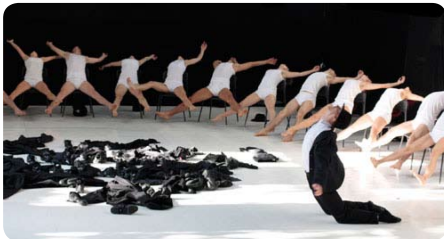
6 октября, «Минус 2»

Хореограф Охад Нахарин: «Минус 2» – это спектакль-реконструкция. Я люблю брать кусочки и отрывки из уже существующих произведений и перерабатывать их по-новому, чтобы дать возможность взглянуть на них под другим углом. Я взял фрагменты из различных работ. Казалось, будто я пытаюсь рассказать одновременно начала, середины и концовки сразу нескольких историй. Однако финальный результат оказался не менее цельным, чем исходный материал, если не более».