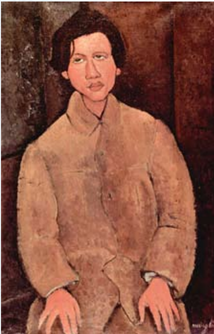
Портрет Хаима Сутина, 1916, худ. А.Модильяни