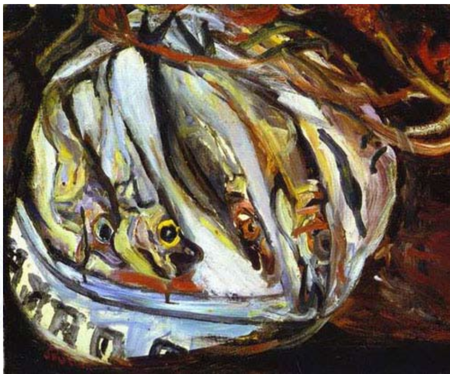
Натюрморт с селедками

В Париже Хаиму Сутину жилось непросто. Его попытки хоть что-то заработать были не слишком успешными — и в силу особенностей характера, и в силу тщедушности. Через день-другой, убедившись в его полной непригодности к труду, особенно к физическому, Сутина указывали на дверь. Соседи по пансиону годы спустя вспоминали, что по ночам, не в силах бороться с приступами мучительного голода, Сутин стучал в первые попавшиеся двери и требовал, чтобы ему дали немного хлеба.