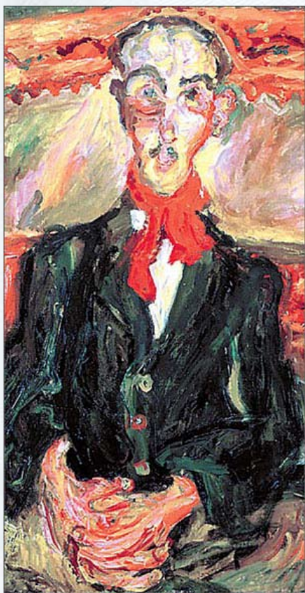
Хаим Сутина, «Портрет мужчины в красном шарфе» (1921)

На Западе сумасшедший художник, выходец из нищего захолустного местечка, сегодня запредельно дорог. На аукционах «Кристи» в начале 90-х годов цены на работы Сутина измерялись миллионами долларов.