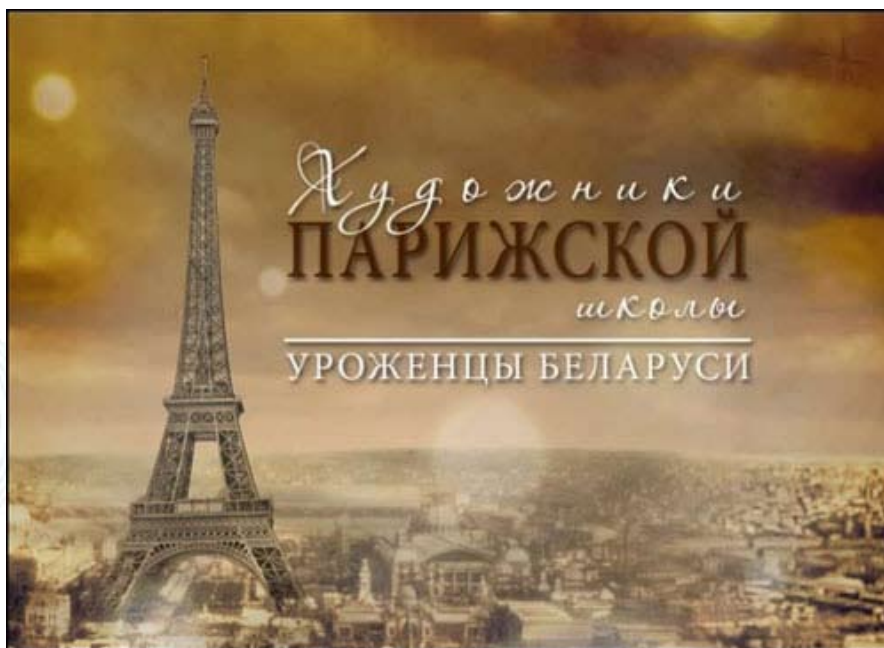
Кадр из фильма Олега Лукашевича «Художники Парижской школы — уроженцы Беларуси»

Подготовка к осенней выставке в Национальном художественном музее идет полным ходом, и в рамках этой экспозиции состоится премьера получасового фильма «Художники Парижской школы — уроженцы Беларуси». О работе над ним рассказал его режиссер, известный белорусский тележурналист Олег ЛУКАШЕВИЧ.