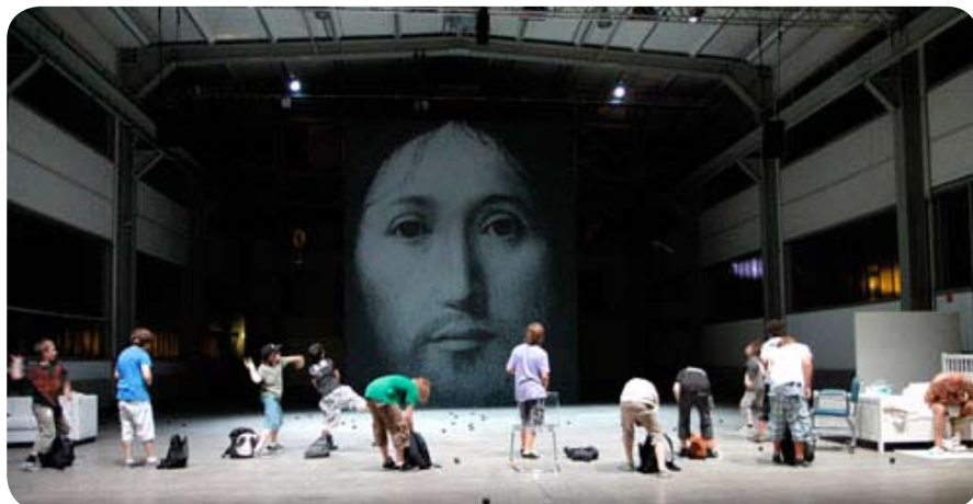
10 октября, «О концепции Лика Сына Божьего»

Режиссер Ромео Кастелуччи: «Это начало. Я хочу увидеть Иисуса после Его столь долгого отсутствия. Здесь нет лика Иисуса. Я вижу живописные полотна и скульптуры. Я знаю, что в прошлом тысячи художников могли потратить полжизни, чтобы воспроизвести невыразимую, почти невидимую складку печали на Его устах. А что сегодня? Сегодня Его там нет. Воля – вот единственное, что продолжает Его путь во мне. Речь о том, чтобы совместить Его лик и волю. Я желаю предстать перед ликом Иисуса, и что больше всего поражает меня самого – это первая часть предложения: “Я желаю”».