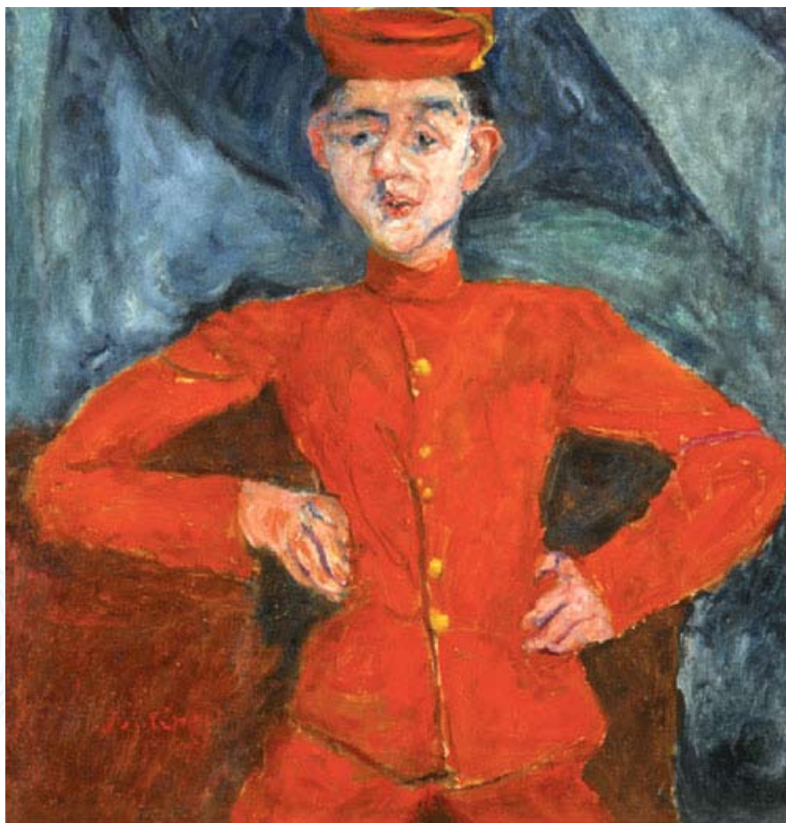
Хаим Сутин, «Посыльный из Максима» (1925)

А в мае этого, 2012 года, на Sotheby's его «Посыльный из Максима» был продан за 9,37 миллиона долларов.