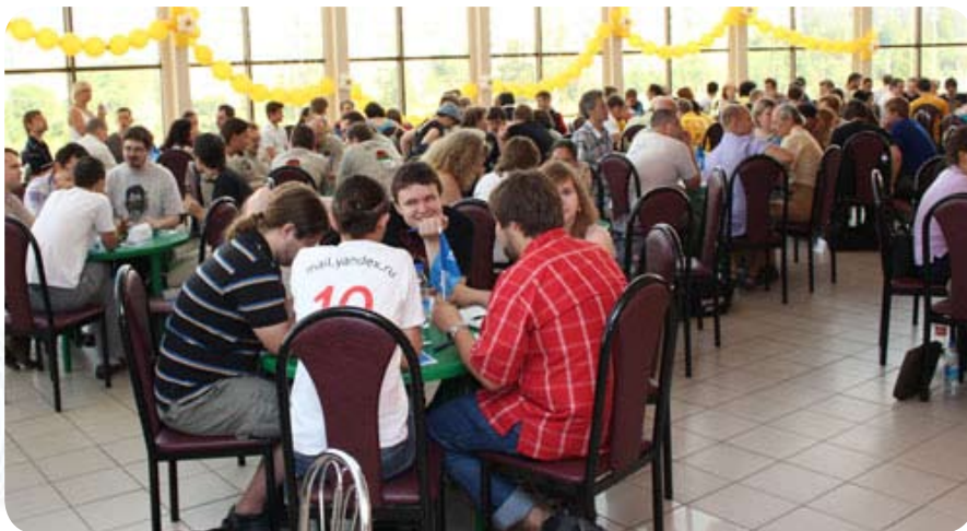
Ледовый дворец в Витебске на два дня превратился в арену интеллектуальных игр