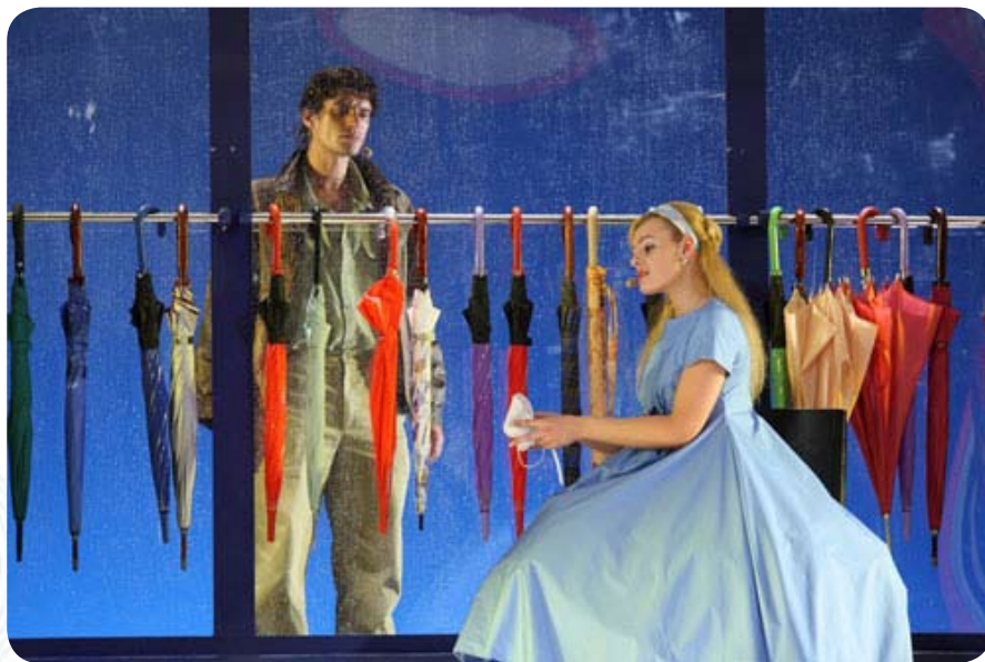
2 октября, «Шербурские зонтики»

Первая фестивальная неделя вместит в себя спектакли различных жанров и направлений. Начнется «ТЕАРТ» с программы «Золотой маски», затем будет белорусско-польский спектакль «Амазония», после чего Латвийский национальный театр представит свою версию «Мертвых душ» Кирилла Серебренникова, и завершится «коктейль» двумя пластическими спектаклями Польского театра танца.