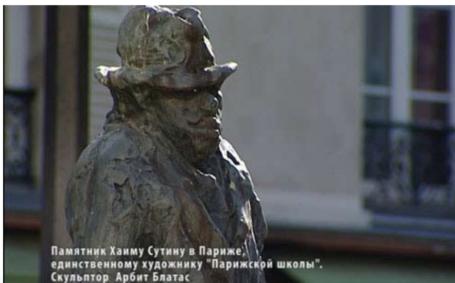
Памятник Хаиму Сутину в Париже, единственному художнику "Парижской школы". Скульптор Арбит Блатас

Если Шагал и тот же Пикассо в XX веке были, что называется на слуху, то о Сутине при жизни знали мало, несмотря на то, что его картины находились в лучших музеях мира. Однако впоследствии на аукционах за них платили большие деньги. Вышло несколько посвященных творчеству художника монографий. О жизни Сутина написано несколько книг. Снято несколько фильмов. И наконец, в центре Парижа, на Монмартре установлен памятник.