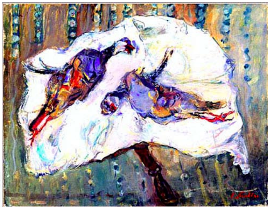
Два фазана на столе, 1926

Возможно, единственный из больших художников, Сутин подсознательно воспринял и отразил в картинах слом всего прежнего, трагический разрыв пресловутой «связи времен».