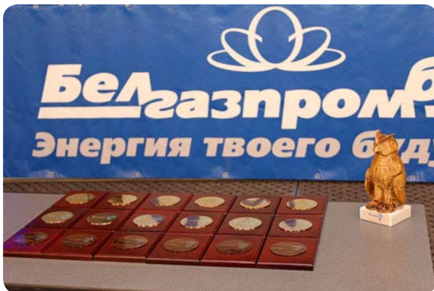
Так выглядели награды за победу в турнире