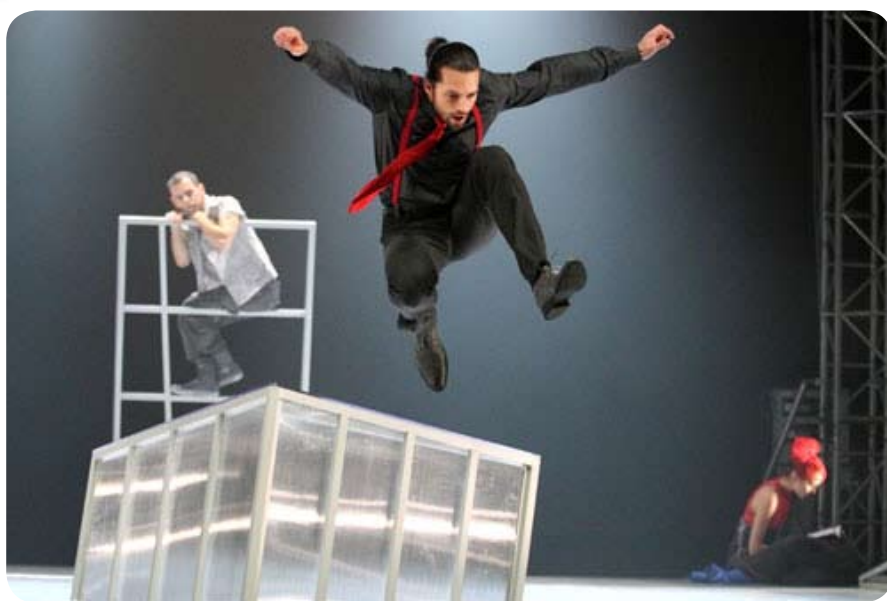
7 октября, «Дезерт» («Пустыня»)

Продолжительность спектакля – 75 минут (без антракта).