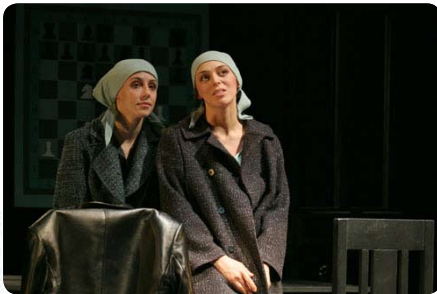
15-16 октября, «Ничья длится мгновение»

Заключительная фестивальная неделя представит собой «микс» из различных стилей. Откроет ее очень пронзительный спектакль «Ничья длится мгновение», затем будет «Одна летняя ночь в Швеции», посвященная Андрею Тарковскому. Кроме этого, в программе «ТЕАРТа» будут весьма неоднозначные, но признанные критиками и зрителями спектакли «Персона. Мэрилин» и «Ребенку дают слабительное». А завершится «ТЕАРТ» национальной премьерой по классическому произведению Владимира Короткевича «Ладья отчаяния».