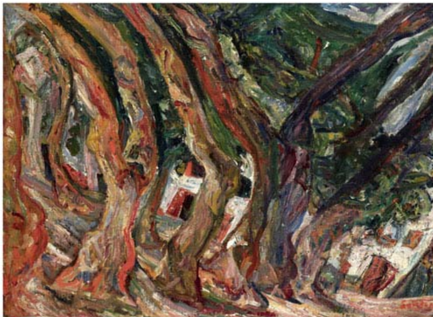
Платаны в Сере, 1920

В Париже Хаиму Сутину жилось непросто. Его попытки хоть что-то заработать были не слишком успешными — и в силу особенностей характера, и в силу тщедушности. Через день-другой, убедившись в его полной непригодности к труду, особенно к физическому, Сутина указывали на дверь. Соседи по пансиону годы спустя вспоминали, что по ночам, не в силах бороться с приступами мучительного голода, Сутин стучал в первые попавшиеся двери и требовал, чтобы ему дали немного хлеба.