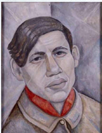
Портрет Сутина, 1955, худ. Маревна