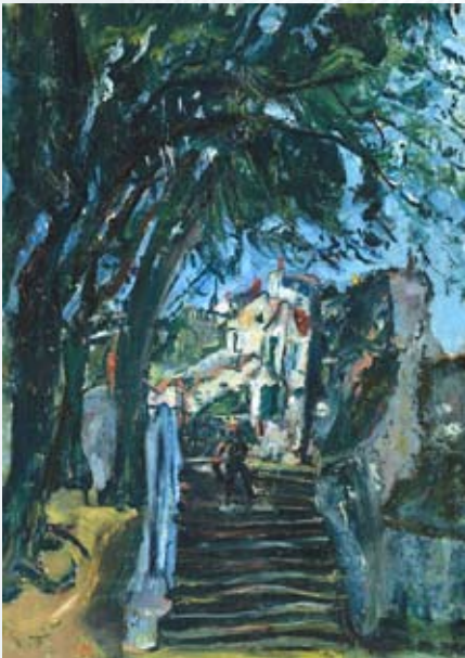
Лестница в Шартре, около 1933