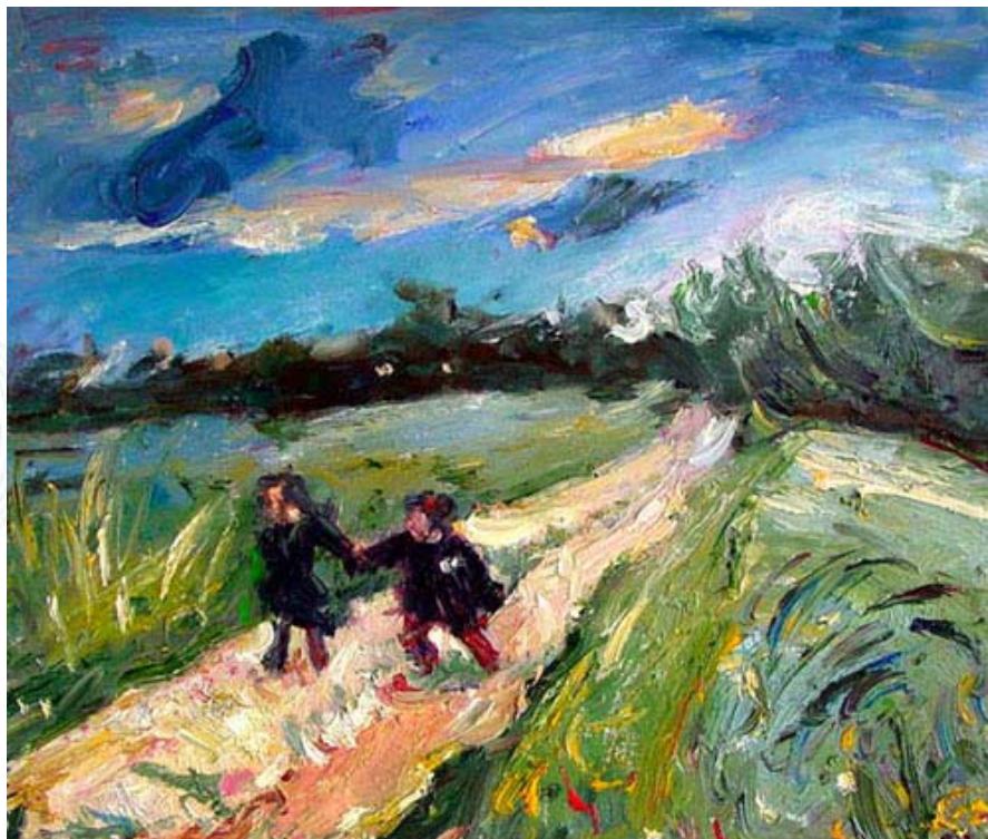
Возвращение из школы после грозы, 1939