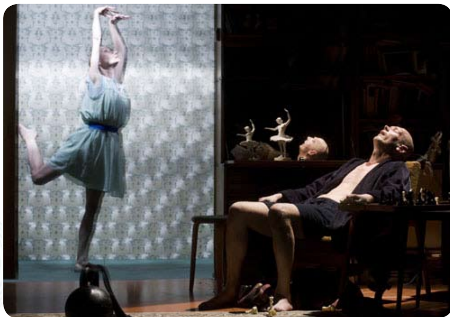
8 октября, «Миранда»

Вторая неделя «ТЕАРТа» вместит в себя исключительно «тяжелую артиллерию». Вначале зрителям будут представлены две постановки Оскара Коршуноваса, затем им предстоит увидеть спектакль не менее именитого режиссера Ромео Кастелуччи, после чего познакомятся с произведением «Загни мой огонь» нашумевшего Театра.doc, чьи спектакли в жанре документального театра отличаются своей злободневностью.