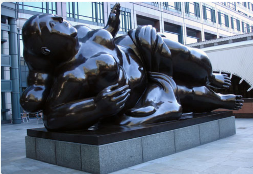
Скульптура Фернандо Ботеро Broadgate Venus перед входом в здание ЕБРР на Exchange Square в Лондоне

Я считаю проведение таких встреч правильным даже в условиях кризиса. В первых, бизнес не прекращается и в период экономического спада, во-вторых, происходит подготовка деловых решений для завтрашнего бизнеса. Думаю, представление Беларуси европейским инвесторам должно повысить интерес иностранных инвесторов к белорусским субъектам хозяйствования.