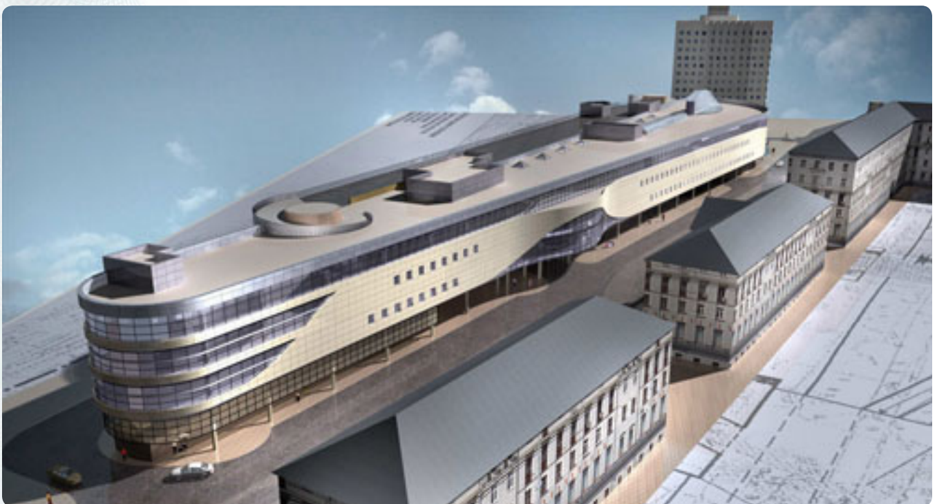
Проект автовокзала «Центральный»

Очень люблю политику. Ежедневно минимум полтора часа трачу на просмотр новостей по телеканалам разных стран. Это для меня обязательно, как молитва. Чтобы понимать процессы в экономике, нужно знать, что происходит в политике.