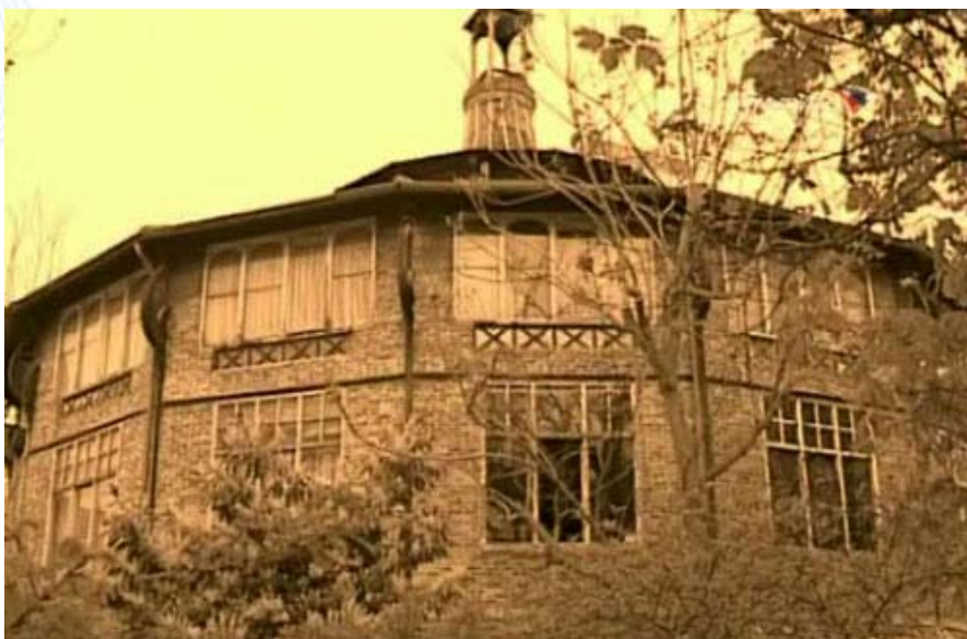
Вид на «Улей». Кадр из фильма «Марк Шагал».