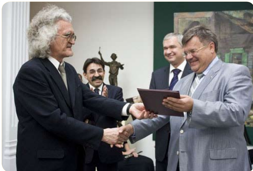
Торжественная церемония состоялась 24 июля в рамках праздничных мероприятий, посвященных 125-летию со дня рождения Марка Шагала