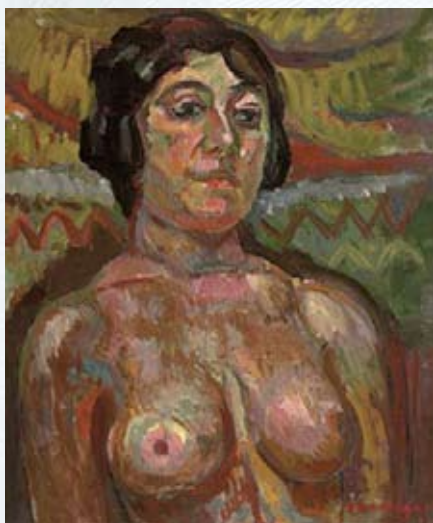
Пинхус Кремень. «Обнаженная», 1920