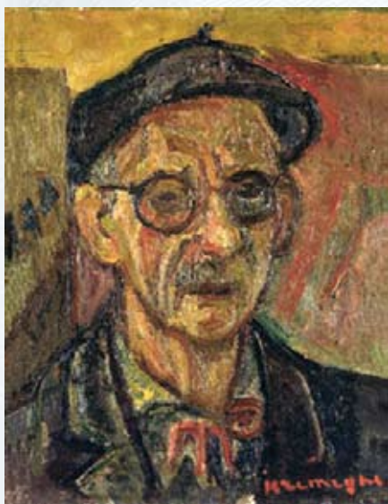
Пинхус Кремень. «Автопортрет»

Пинхус Кремень (фр. Pinchus Kremegne , 28 июля 1890, Желудок, близ Лиды, Российская империя — 5 апреля 1981, Серре, Восточные Пиренеи, Франция). Кроме живописи, занимался также скульптурой и графикой. Родился в еврейской семье, отец — ремесленник. В 1909—1910 учился в художественной школе Вильно, где познакомился с Сутиным и Кикоиным.