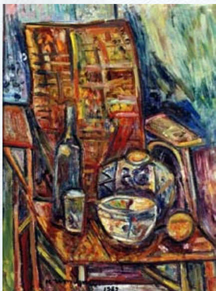
Пинхус Кремень. «Натюрморт», 1952

Вторую мировую войну Пинхус Кремень провел на юге Франции, в департаменте Коррез. В 1945-м окончательно поселился в Сере и построил себе здесь дом. Это местечко на границе с Испанией, привлекавшее многих живописцев, впоследствии обзавелось крупным Музеем современного искусства, и среди полотен Матисса, Пикассо, Шагала, Сутина здесь есть и несколько картин Кременя.