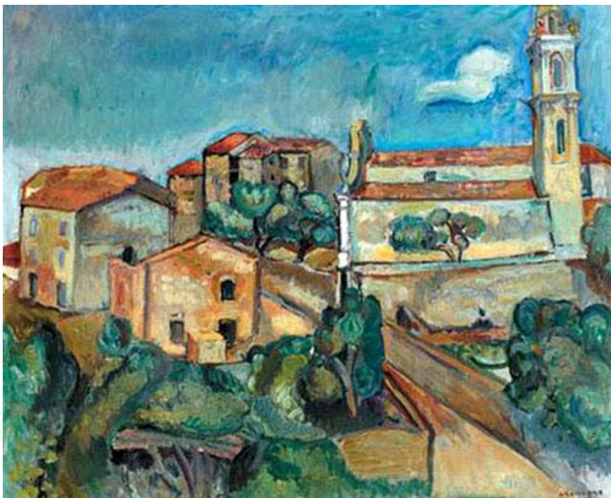
Пинхус Кремень. «Городок», 1926