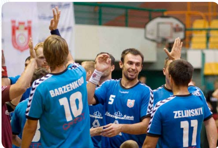
2009 год, БГК имени Мешкова празднует завоевание второго "Кубка Белгазпромбанка"