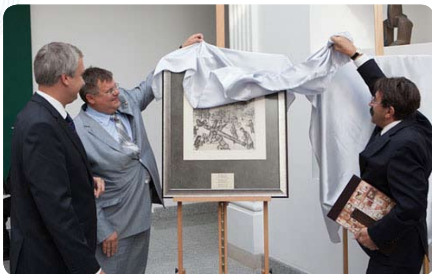
Важность и значимость события подчеркивал уровень приглашенных гостей, среди которых был министр культуры Павел Латушко (слева) и посол Израиля в Беларуси Иосиф Шагал (справа)