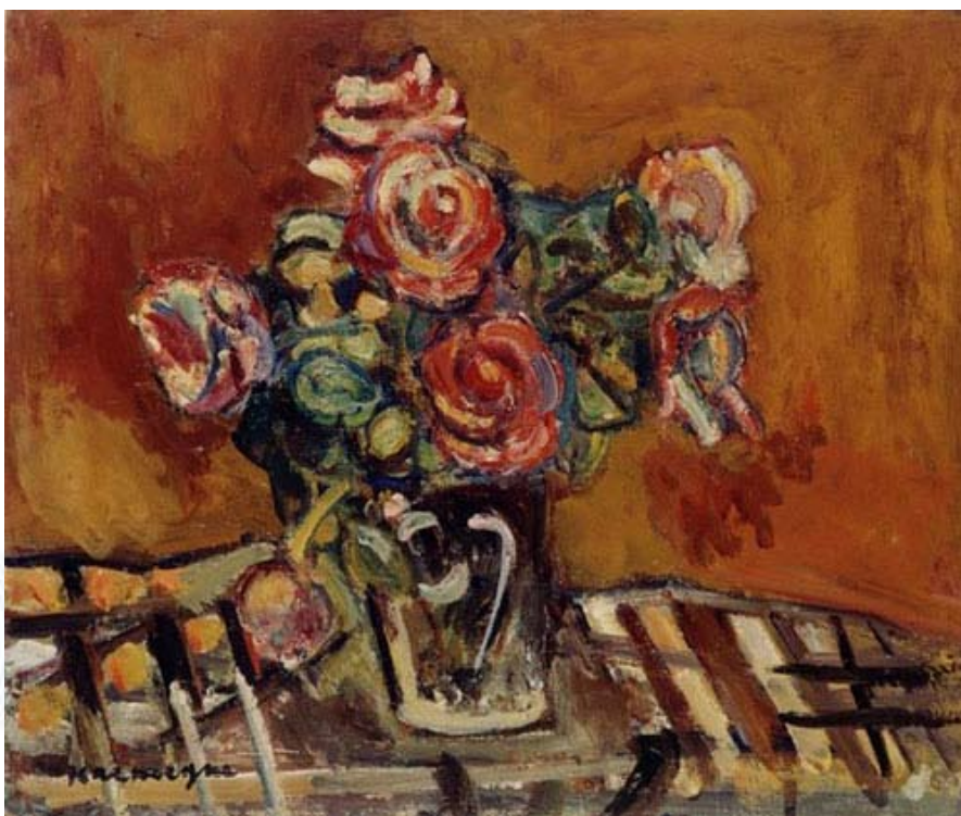
Пинхус Кремень. «Натюрморт», 1930