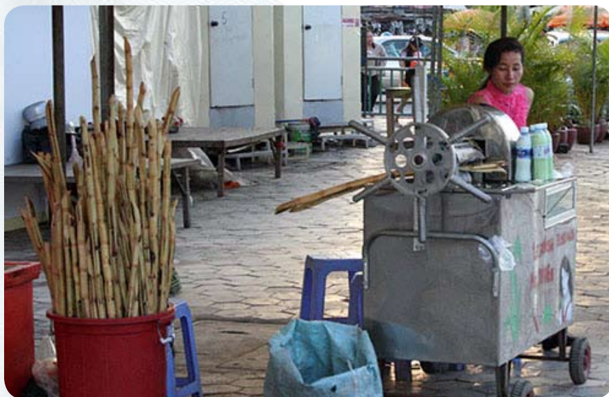
Передвижная давилка с ручным прессом, через который пропускают побеги бамбука и получают свежавыжатый бамбуковый сок.