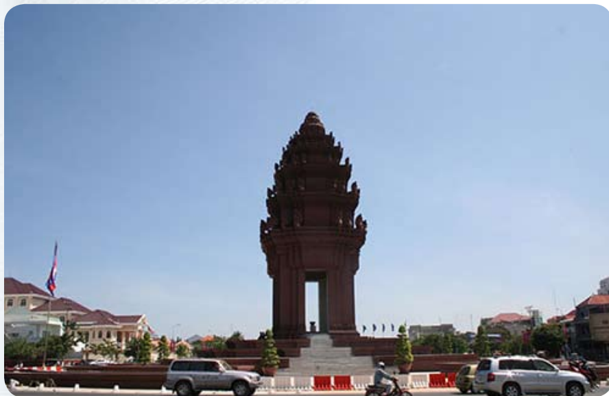
и монумент Независимости