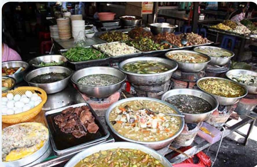
Местная версия наших кулинарий