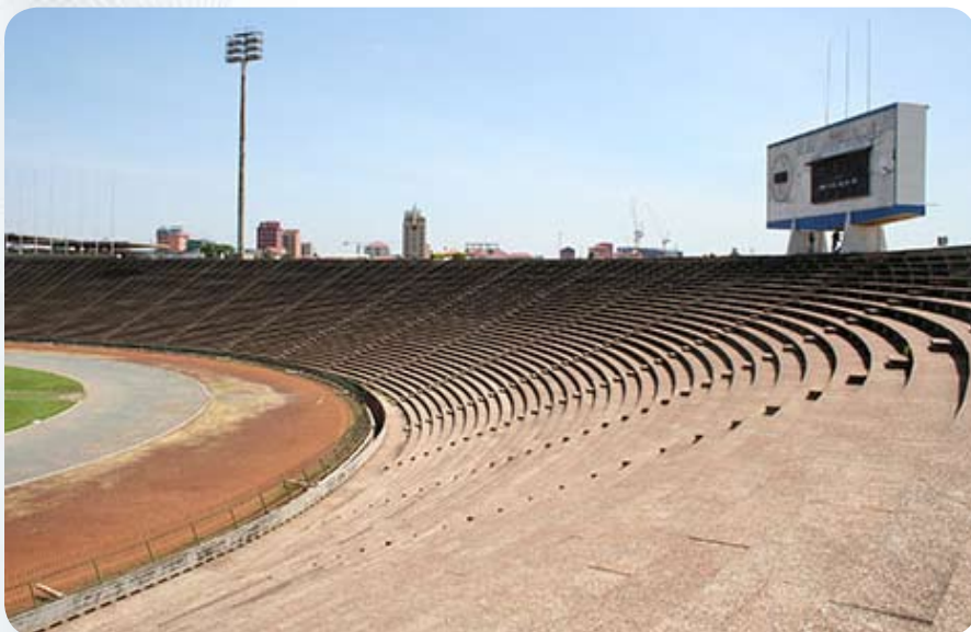
Из остальных достопримечательностей – Олимпийский стадион