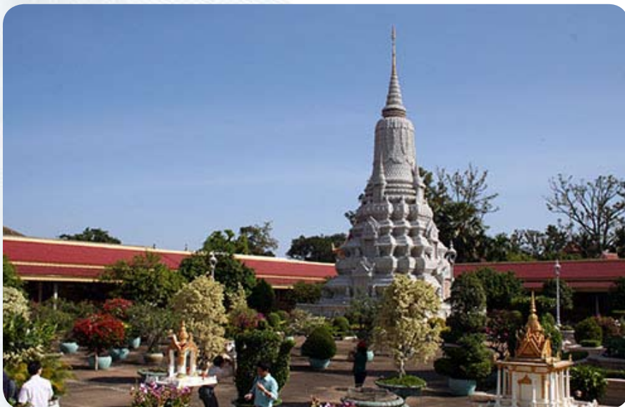
Конусообразные сооружения называются ступами, в них хранится прах умерших королей.