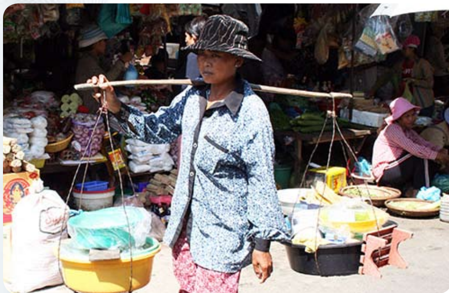
Такие тетушки разносят еду для торговцев