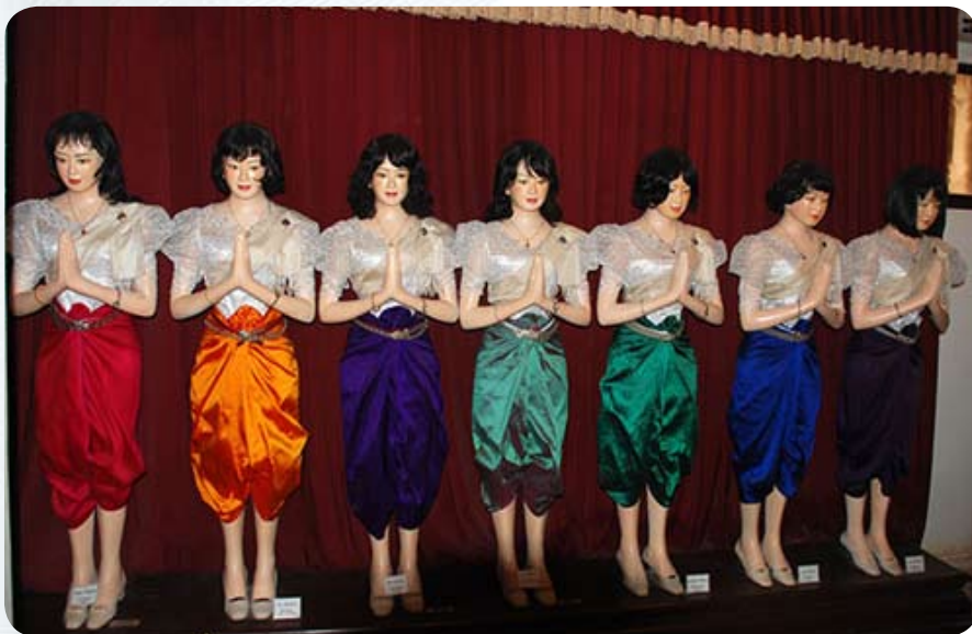
Местный вариант «недельки»: на каждый день недели у прислуги королевского дворца есть свой цвет