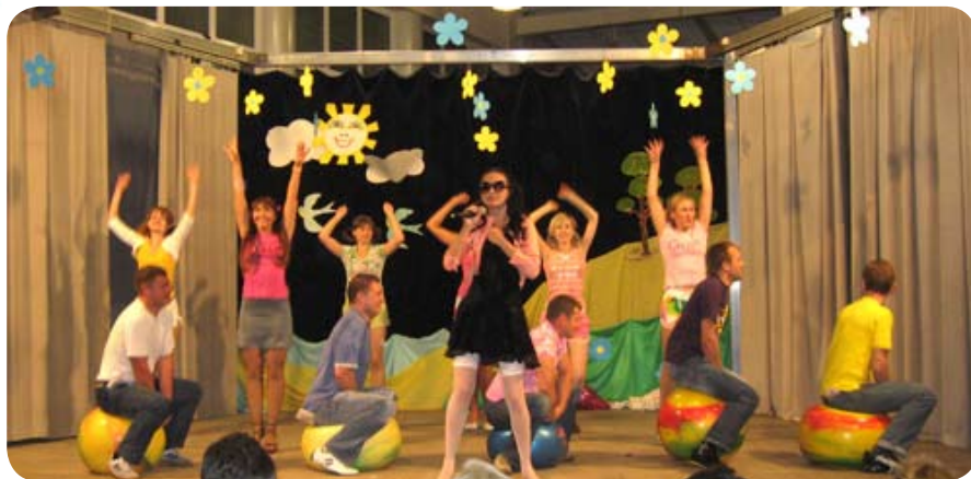
Свою Елку, летящую на большом воздушном шаре, представил могилевский филиал