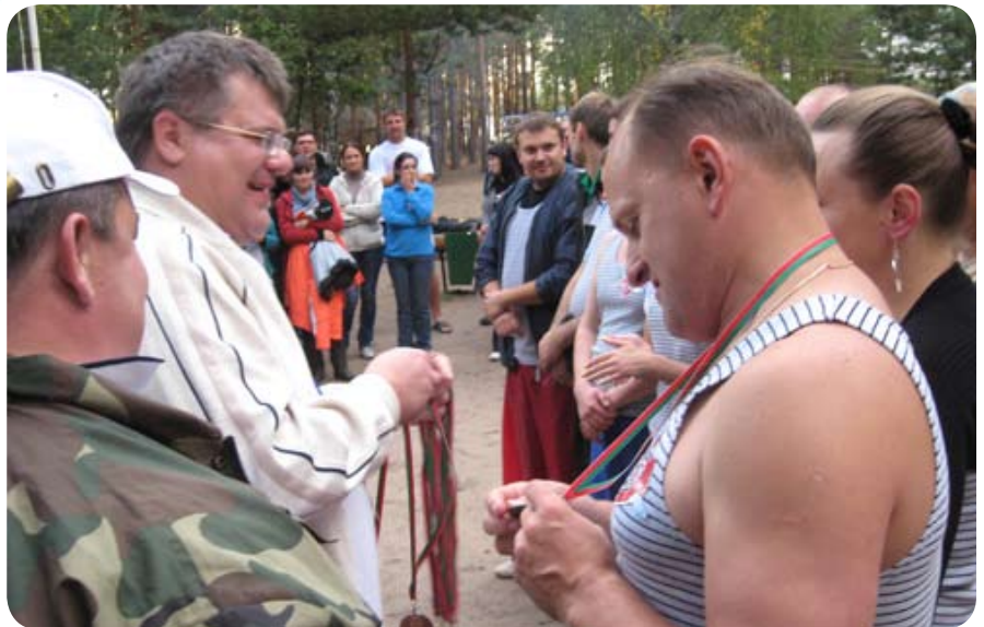
Потом вручались командные призы. Сначала – «бронзовой» «Большой Рознице»...