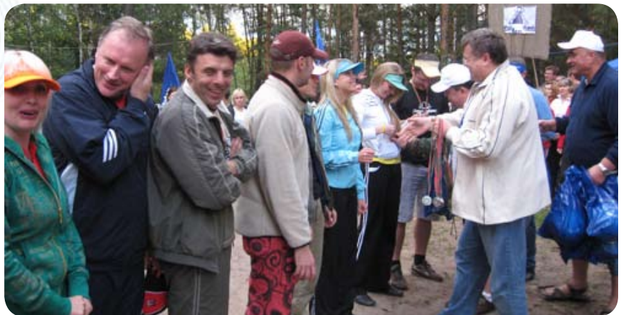
... затем — серебряной «Северной губернии»...