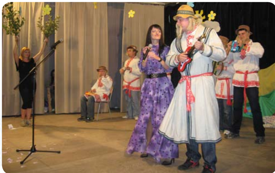
Национальные мотивы всегда были визитной карточкой гродненского филиала