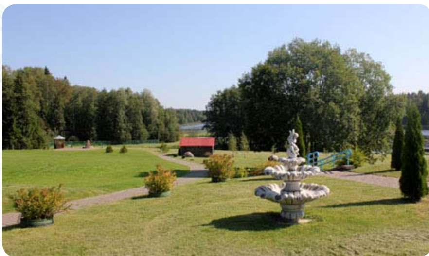
Это очень уютное, живописное место в 45 км от Минска, по мядельскому направлению с прекрасным озером — нечто вроде базы отдыха, но более высокого уровня

Организацией турслета занимались как наши сотрудники из департамента корпоративного бизнеса, управления делами, так и приглашенные специалисты, которые дали нам очень важные профессиональные советы, пригласили аниматоров, ведущих, разработали интересный сценарий.