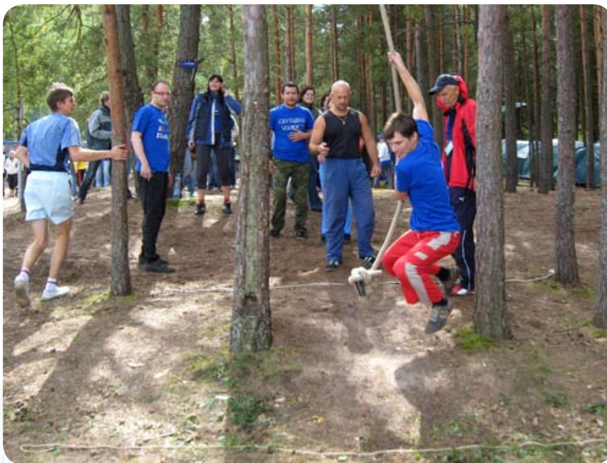
Затем была «Тарзанка»