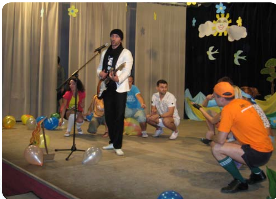
...и на знаменитого юмориста – чемпиона высшей лиги КВН и резидента Comedy Club Семена Слепакова показал, что уровень творческих конкурсов вырос еще больше