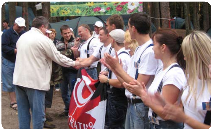
... и в завершение — «золотой» «Корпоративке»