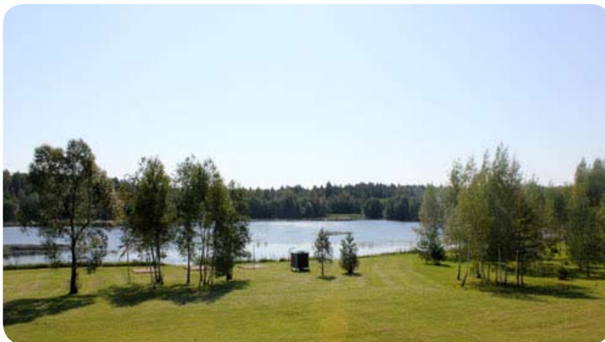
Турслет состоялся на базе государственного лесохозяйственного управления «Красносельское» Управления делами Президента Республики Беларусь