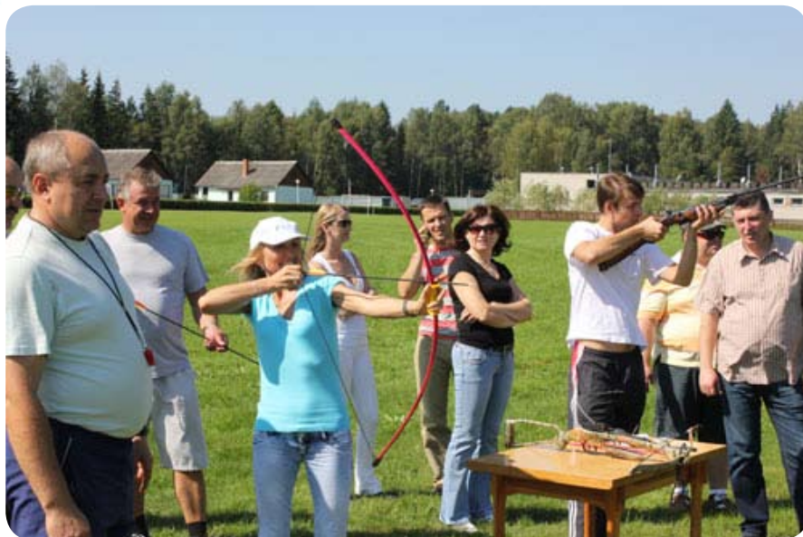
В целом мероприятие проходило достаточно весело, задорно – была и спортивная программа, и культурные мероприятия