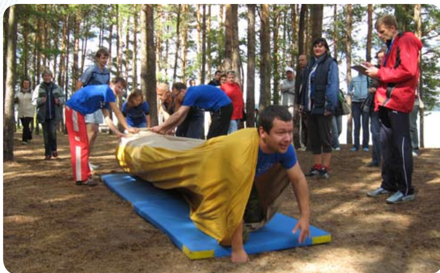
...и на одном дыхании пролетели «мешок»