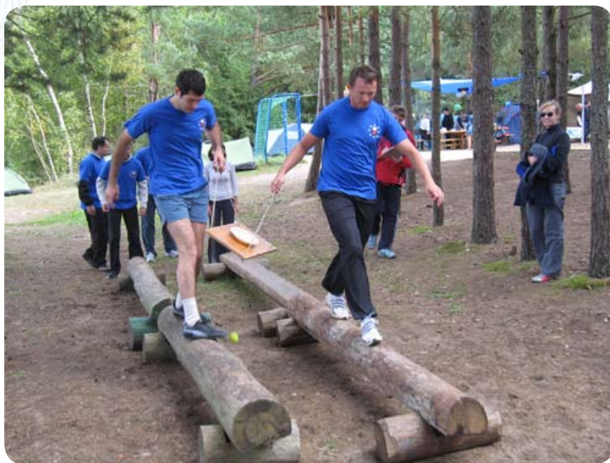
... что оказалось не так просто!