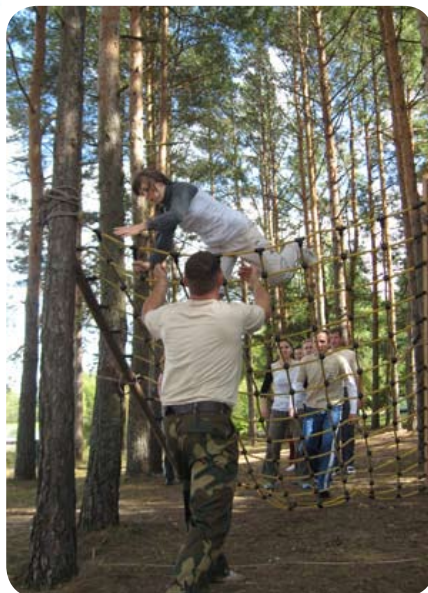
Затем участники команд преодолели веревочную лестницу...