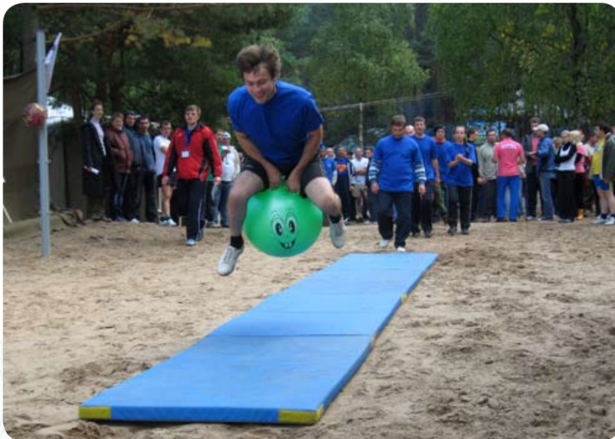
Первый этап – прыжки на мяче. Рекордный прыжок удался представителю команды второго филиала

Следующим конкурсом стала спортивно-туристическая полоса.