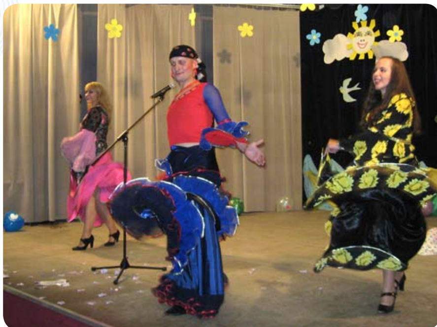
...Второй филиал показал хореографическую зарисовку