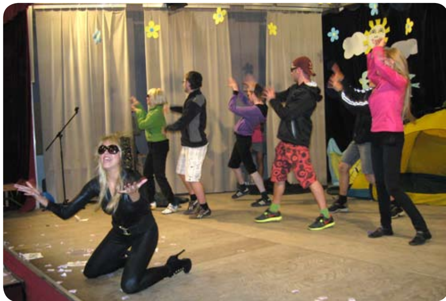
Вариации были самые различные. Сборная витебского филиала выпустила свою «Леди Гагу»...