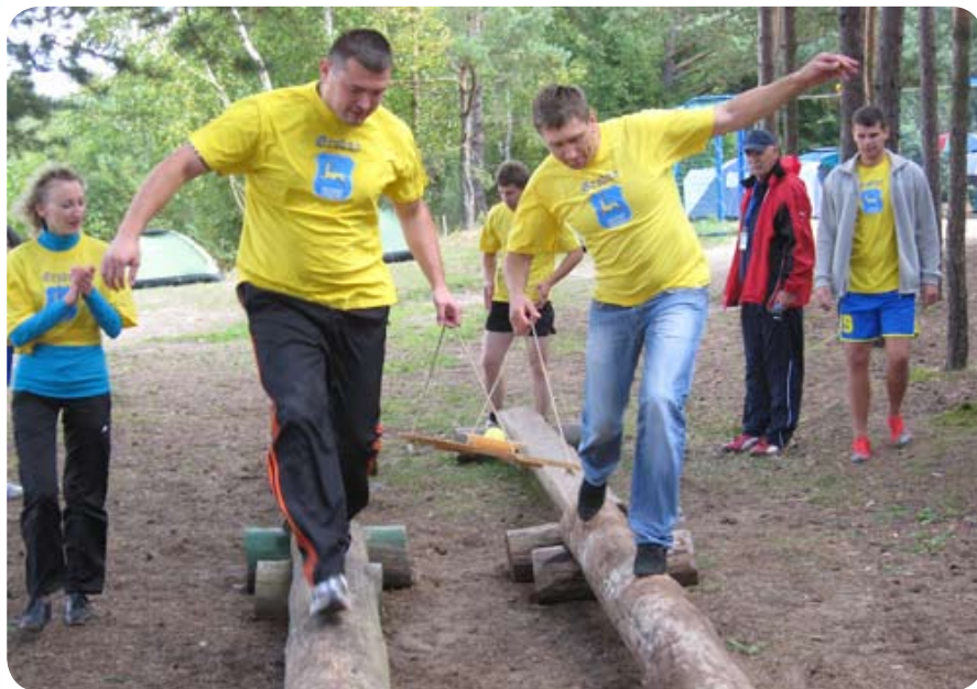
После предстояло пройти по шатающимся бревнам, удержав на тарелке теннисный мячик...